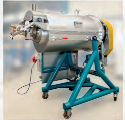
Pilotofen Elektrisch beheizter Trommelofen