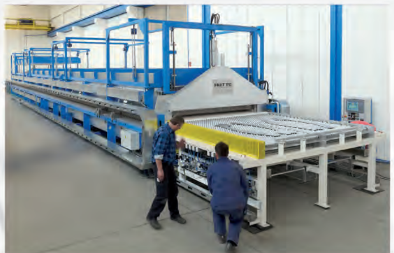
Roller hearth furnace, direct electrical heated Rollenherdofen, direkt elektrisch beheizt