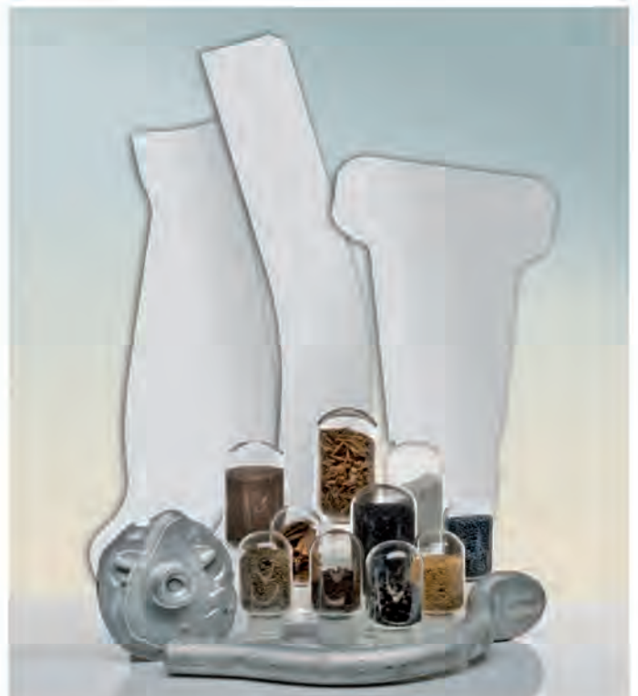
Products treated in HÜTTE furnaces Produkte, die in HÜTTE Ofenanlagen wärmebehandelt wurden