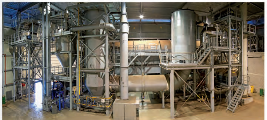
Completion, start-up, production support Kompletierung, Inbetriebnahme, Produktionsbegleitung