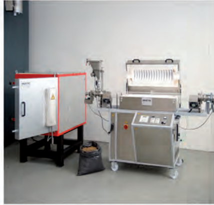
Research & Development Versuch & Entwicklung